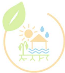
AK Klima- anpassung