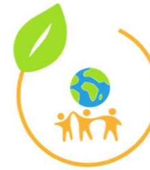
AK Lokal - Sozial - Global