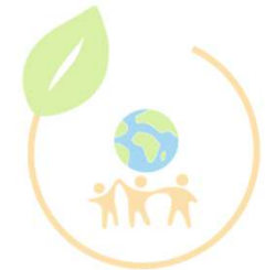
AK Lokal - Sozial - Global