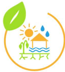
AK Klima- anpassung