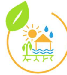
AK Klima- anpassung

jeden ersten Mittwoch im Monat, 19:00 im Agenda Treffpunkt