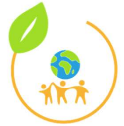
AK Lokal - Sozial - Global

nächster Termin Mo 09.03. um 16:00 Uhr im Treffpunkt