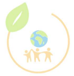
AK Lokal - Sozial - Global