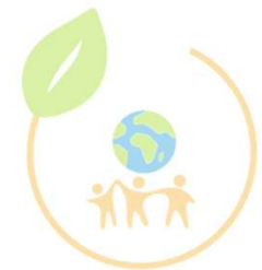
AK Lokal - Sozial - Global