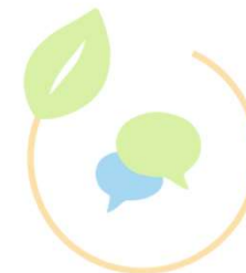
AK Kommu- nikation