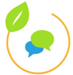
AK Kommu- nikation