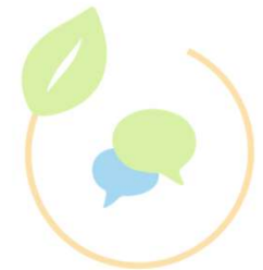
AK Kommu- nikation

Gemeindevertretung Unterhaching: noch offen