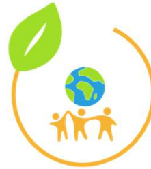
AK Lokal - Sozial - Global