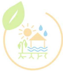
AK Klima- anpassung