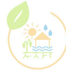
AK Klima- anpassung